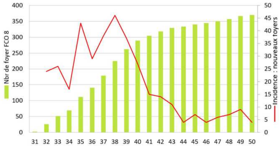
Evolution hebdomadaire de l'épidémie de FCO sérotype 8 sur le Tarn

Pour rappel, la FCO est une maladie « non contagieuse » dite vectorielle : le virus est véhiculé par des culicoïdes (moucheron piqueurs). Plus il y a de culicoïdes et plus on peut s'attendre à de fortes contaminations. L'incidence de l'épidémie a donc été maximale en août et en septembre ! Mais de nouveaux élevages ont encore été déclarés foyer en décembre. Voir schéma ci-contre.