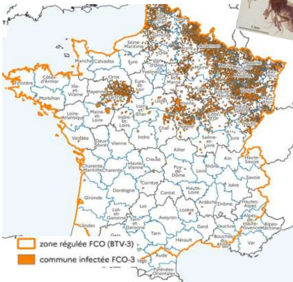
Carte des foyers FCO3 en France début janvier 2025

Rappel des principaux symptômes à surveiller : fièvre, tête gonflée, œdème, difficultés de locomotion, croûtes sur le mufle, ulcérations dans la bouche, salivation, jetage, langue bleue et amaigrissement.